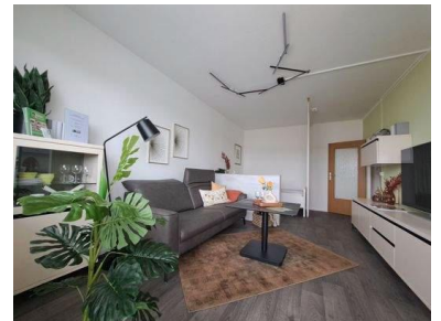
Wohn- und Schlafraum