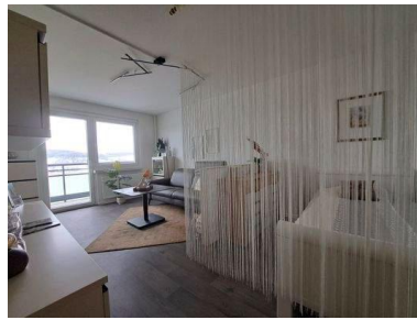
Wohn- und Schlafraum