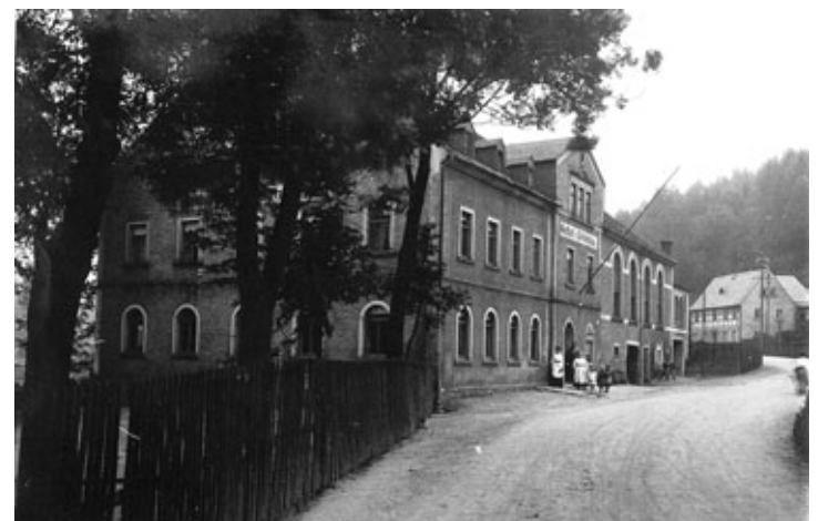
Gasthof „Zum Zwönitztal“ (ehem. Obere Hauptstraße 72)