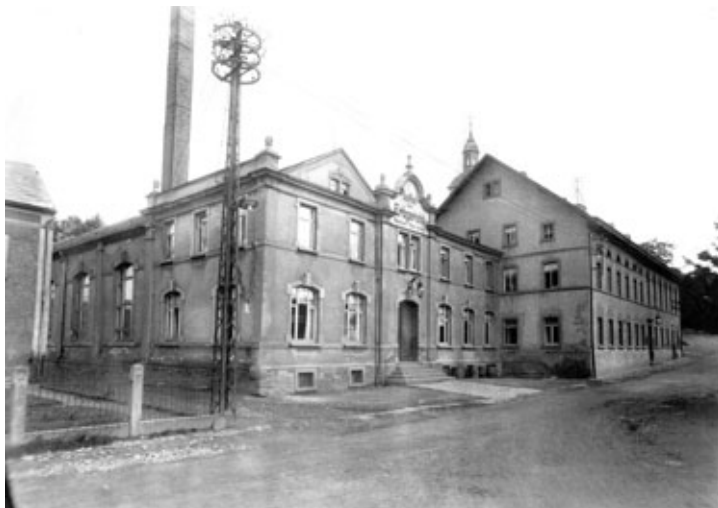
Gasthof „Zum Erbgericht“ (ehem. Obere Hauptstraße 1)