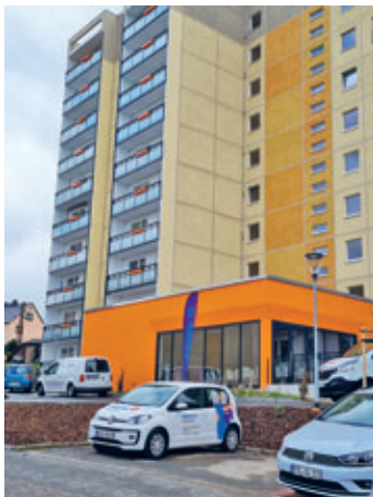
Hochhaus von außen