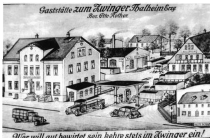
Restaurant „Zum Zwinger“ (ehem. Obere Hauptstraße 43)

Knapp 5.000 der 7.949 Thalheimerinnen und Thalheimer waren 1924 zur Stimmabgabe aufgerufen und trotz des sicher kalten Januar-Sonntags strömten 78 % der Wahlberechtigten (im Jahr 1926: 81 %) in die Wahllokale. Auch damals gab es in Thalheim vier Wahlbezirke. Die Wahllokale mussten für jeweils gut 1.000 Personen geeignet sein, was besonders in Gasthäusern gegeben war. Und so zogen sich die vier Wahllokale in den 1920er-Jahren wie eine Perlschnur entlang der Hauptstraße: