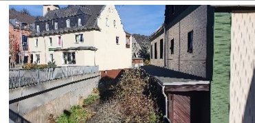
Verlauf der Zwönitz am Rathaus