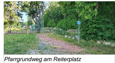
Pfarrgrundweg am Reiterplatz