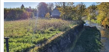
Mauer entlang der Zwönitz