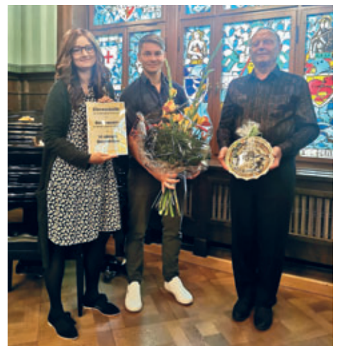
2023 – Gratulationen und Besuch anlässlich des 10-jährigen Amtsjubiläum am 01.08.2023