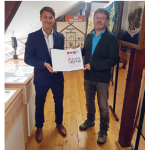
2021 – Gratulation zur Wiedereröffnung beim Heimatkundlichen Verein