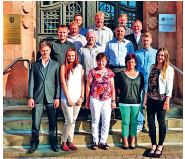
2014 – Ein neuer Stadtrat wurde gewählt.

Das ist eine gute Frage. Ich habe mich schon immer ehrenamtlich engagiert und für die Belange der Stadt interessiert. Über Thalheim lag damals eine dunkle Wolke, die ich gern beseitigen wollte – und habe deswegen als Bürgermeister kandidiert. Das eigentliche Ziel war, etwas mehr Bekanntheit zu erlangen, da ich 2014 in den Stadtrat gewählt werden wollte. Nachdem die Wahl zunächst abgesagt wurde, konnte ich durch Untersützerschreiben nominiert werden – um dann am 23.06. als einer von 5 Kandidaten letztendlich zum Bürgermeister gewählt zu werden. Zu diesem Zeitpunkt hatte ich wirklich keine Ahnung von Kommunalpolitik, mir fehlte sämtliches Knowhow und ich musste mich als völliger Neuling in alle Bereiche einarbeiten. Ein guter Bekannter sagte einmal zu mir: Kreissaal – Hörssaal – Ratssaal. Das trifft es tatsächlich echt gut.