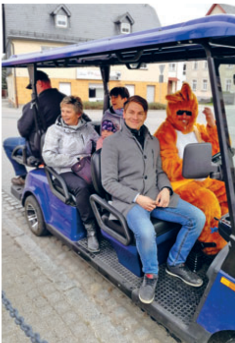
2019 Im Osterhasenmobil