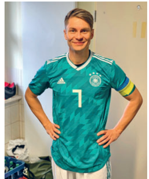
2022 – Unterstützung der Deutschen Fußballnationalmannschaft der Bürgermeister