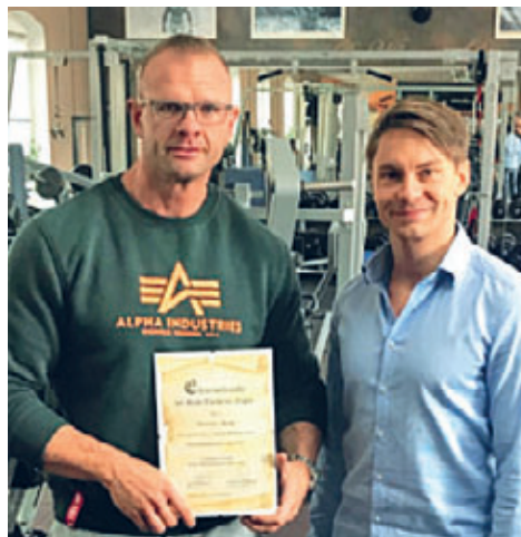
2018 – Gratulation zum 10 jährigen Geschäftsjubiläum im Relax

Das Interview führten die Mitarbeiterinnen des Sachbereichs Pressestelle. ■