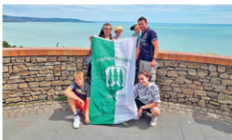
Liebe Urlaubsgrüße aus Tihany/ Ungarn sendet Familie Kuniß.