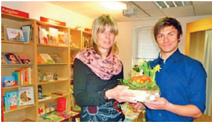
2015 – Gratulation zum Umzug der Buchhandlung in den Sport- & Buchshop

haus, Reiterplatz, Spielplätze, öffentliche Gebäude (Sportlerheim, Vereinshaus) und das nächste Fördermittelprogramm steht bereits in den Startlöchern. Auch die Wahrnehmung der Kinderbürgermeisterinnen und Kinderbürgermeister – lokal wie auch nach außen – ist sehr beeindruckend. Vor allem jedoch die Menschen, die hier leben haben einen großen Teil zu dieser tollen Entwicklung beigetragen. Unsere Partnerschaften Markt Roßtal und Becov, auch die Verbindung internationales Thalheim-Treffen erblüht Jahr für Jahr weiter auf. Ich könnte noch so vieles aufzählen. Auch das Thema Erzgebirgsbad möchte ich in den nächsten Jahren abschließen, damit aus dem Ort des Frustes und der Trauer wieder ein Ort der Freude wird.