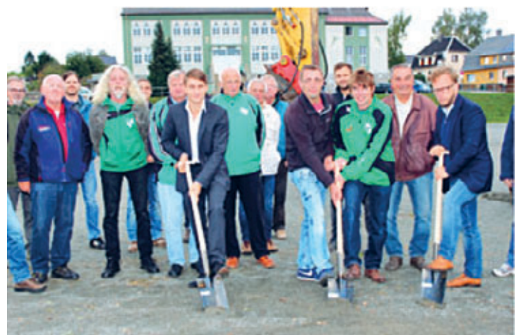
2016 – Offizieller Startschuss zur Sanierung des Sportplatzes an der Stollberger Straße

Das große Thema Bad liegt mir sehr am Herzen. Auch die Bereiche Infrastruktur, Glasfasererschließung, Straßenbau und Hochwasserschutz werden uns in den nächsten Jahren begleiten. Auch die Finanzlage ist stabil, das ist für die Zukunft wichtig, um weiterhin so für unser Bürgerinnen und Bürger da zu sein. Ich wünsche mir vor allem eine große Demokratiebeteiligung, damit wir keinen Rechtsruck erleben müssen. Gemeinsam gestalten, mitmachen und nach vorn schauen, das ist mir wichtig, denn nur zusammen ist man stark. Zuletzt wünsche ich mir, dass ich weiterhin – und noch hoffentlich lange – der Stadt dienen darf.