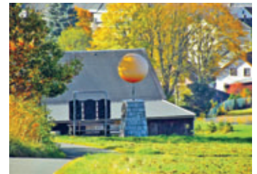
Die Sonne, das Zentralgestirn unseres Sonnensystems

das Neuwürschnitzer Waldbad war das gesuchte Objekt in unserem Bilderrätsel 07/23. Vom 25. bis 27.08.23 findet dort die 600-Jahrfeier dieses Ortes statt. Für den Spätsommer gibt es aber auch anderswo schöne Ausflugsziele. Gar nicht weit von Thalheim entfernt gibt es den hoch interessanten Planetenweg. Ausgangspunkt ist die Sonne. Alles andere erforschen Sie bitte selbst.