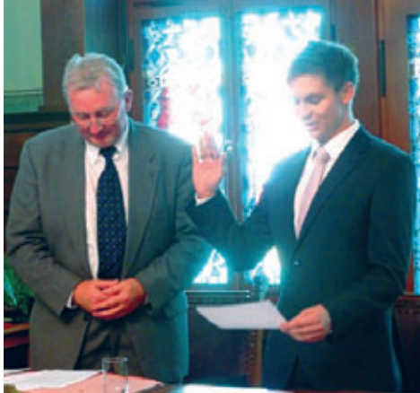
2013 – Amtseinführung des neuen Bürgermeisters

Ich bin unglaublich dankbar, wenn ich auf die vergangenen 10 Jahre zurückblicke: was ich alles erleben durfte, wie viele Menschen ich kennen lernen durfte, was ich alles mitgestalten und wo ich überall mitwirken durfte. Und was uns alles gelungen ist.