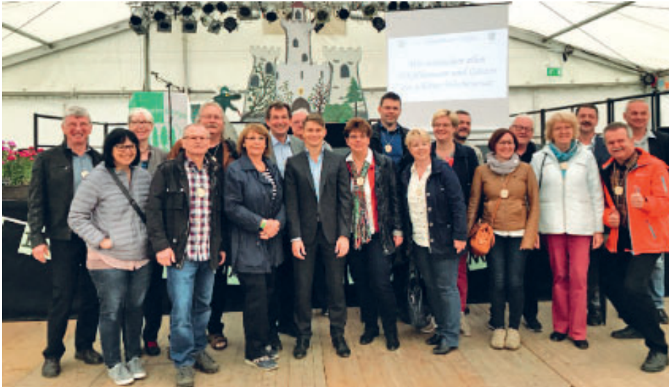
2017 – 57. Internationales Thalheim-Treffen im Erzgebirge