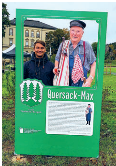
2020 – am Photopoint Quersackmax