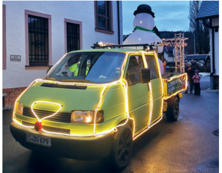
Nach langem Bangen konnte am 21.12.2022 doch das Weihnachtsmobil wieder durch Thalheim fahren und sorgte für viele strahlende Augen. ■