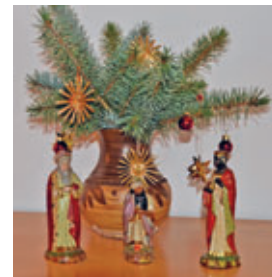
Die „Drei Weisen aus dem Morgenland“ als Figuren einer 130 Jahre alten Pyramide

Haben Sie auch, bestimmt auf einem Weihnachtsberg, auf einer Pyramide oder bei einem Krippenspiel, die „Drei Weisen aus dem Morgenland“ gesehen? Wie heißen diese eigentlich? Aber nicht abgucken, ehrlich!