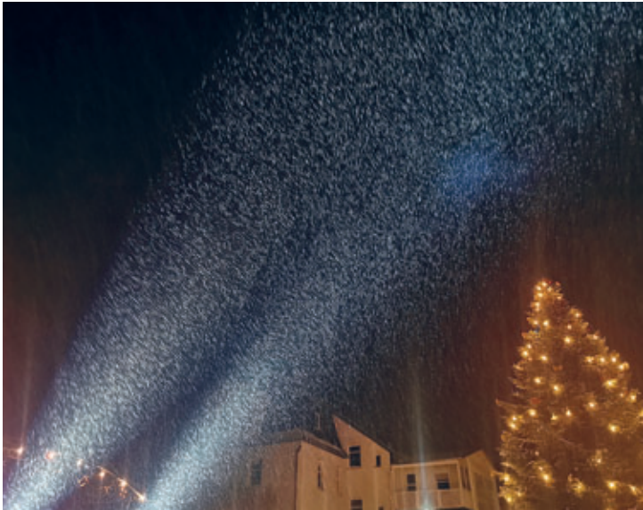
Pünktlich zum Startschuss des Weihnachtsmarktes begann es zu schneien. Das Licht der Strahler erzeugte dabei einen magischen Moment ■