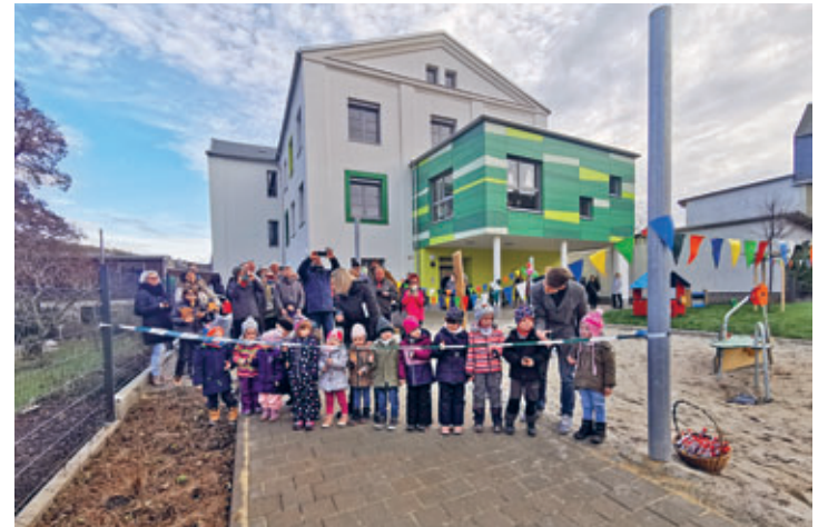
Neueröffnung Kindergarten Gartenstraße