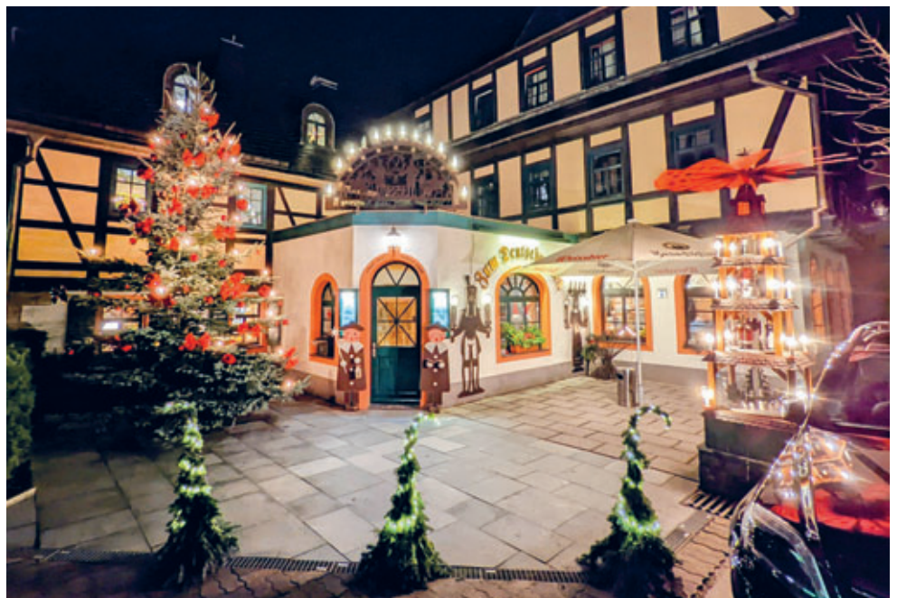
Weihnachten vor dem Deutschen Eck 2022 von Marcus Eszlinger