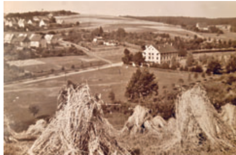
Reiterplatz etwa 1953

Auch der Reiterplatz gehört zu einer der Großbaustellen, welche