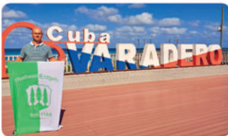
◀ Viele Urlaubsgrüße aus Kuba sendet Heiko Martin ■

Vielen Dank für die schönen Bilder. Wer hat noch mehr schöne Fotos, die in diese Rubrik passen? Wir freuen uns über viele schöne Bilder, die wir auf unserer Facebookseite und in unserem Stadtanzeiger veröffentlichen. Fotos und kurze Info dazu bitte an: pressestelle@thalheim-erzgeb.de ■