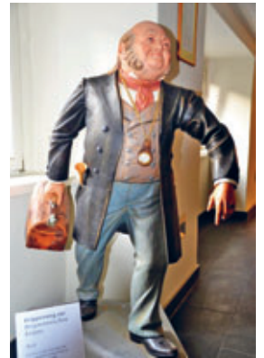
Holzskulptur „Arzt“ des Annaberger Krippenweges

in unserer Novemberausgabe suchten wir das Rathaus der traditionsreichen Erzgebirgstadt Schneeberg, die übrigens im Jahre 1471 gegründet worden ist. Ein Besuch lohnt sich, besonders auch im Museum für bergmännische Volkskunst. Für den Monat Dezember wünsche ich Ihnen ein friedliches Weihnachtsfest im Kreise Ihrer Familien. Und wer einen Ausflug plant, sollte sich vielleicht auf den Annaberger Krippenweg begeben und die wunderbaren, teils lebensgroßen Holzskulpturen bestaunen.