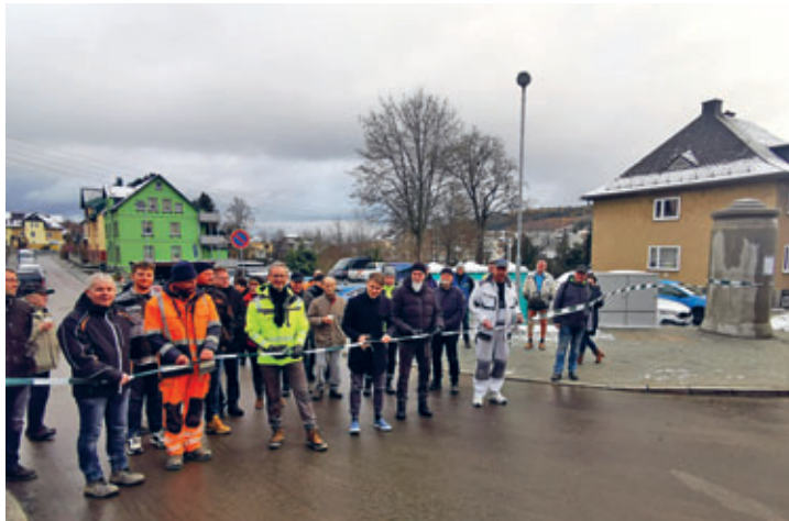
Fertigstellung Großbaumaßnahme Fickergrund