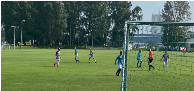
oben: gemischte Mannschaft des SV Tanne unten: Mädchen des FC Erzgebirge Aue

Fußball wird oft als Jungs- beziehungsweise Männersport bezeichnet, was nicht gerechtfertigt ist, denn auch Mädchen und Frauen können Fußball spielen.