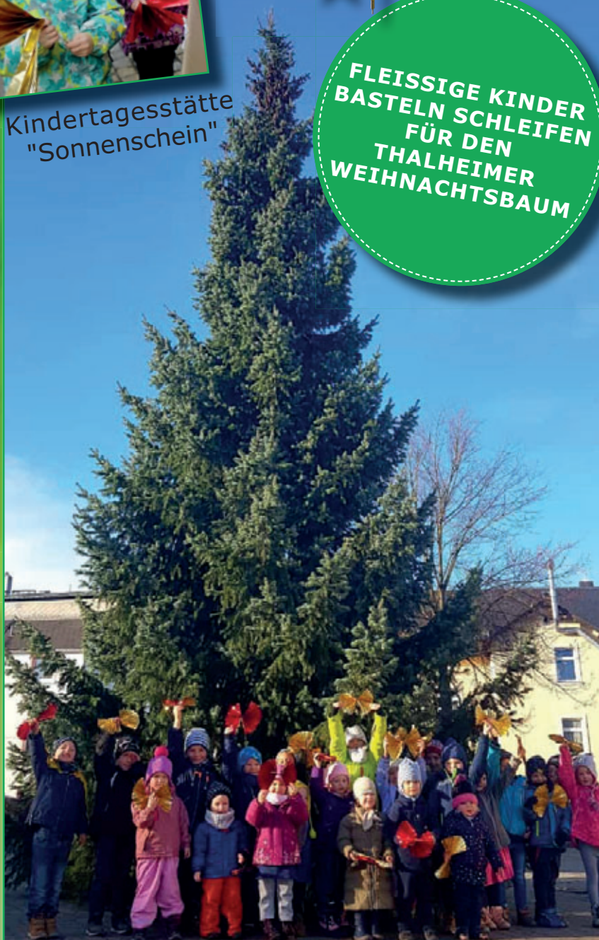
"Kinderland am Steinberg"