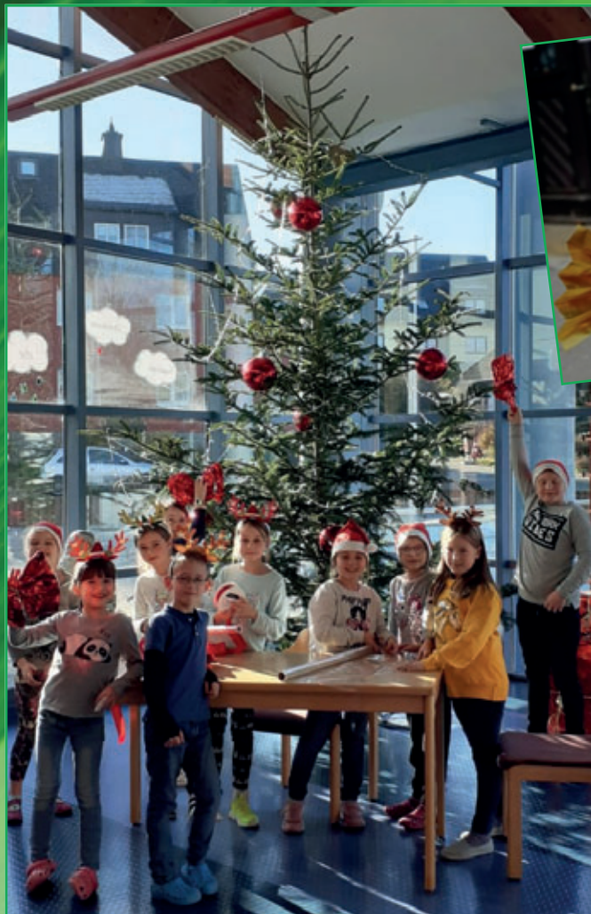
GTA "kreative Hände" der Grundschule

Kostenfreies Amts- und Informationsblatt der Stadt Thalheim/Erzgeb. www.thalheim-erzgeb.de