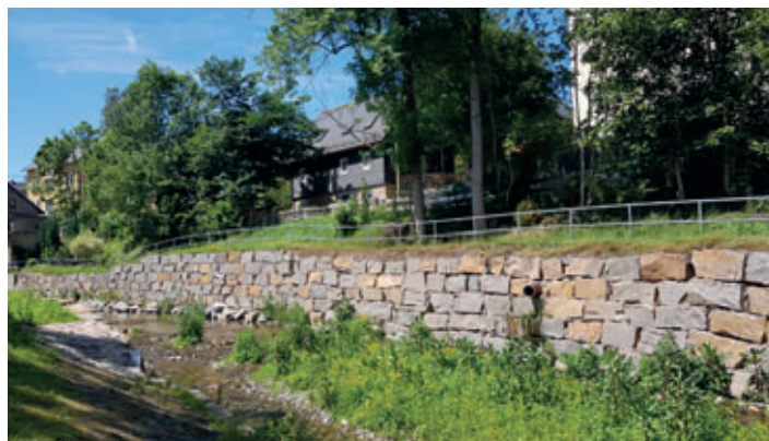
An der Schulstraße wurde die Gewässersohle der Zwönitz auf einer Länge von ca. 130 Metern abgesenkt, das Wehr zurückgebaut und neue Stützmauern errichtet.