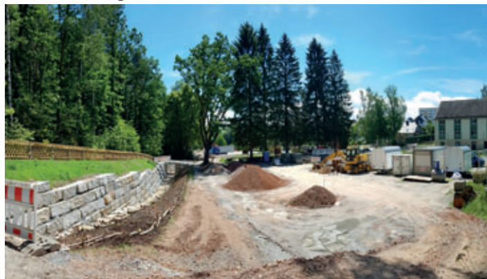
Im Bereich Waldstadion und Bolzplatz am Vereinshaus wurde die Bachverrohrung erneuert und ein Teil des Pfarrgrundwassers offen gelegt.