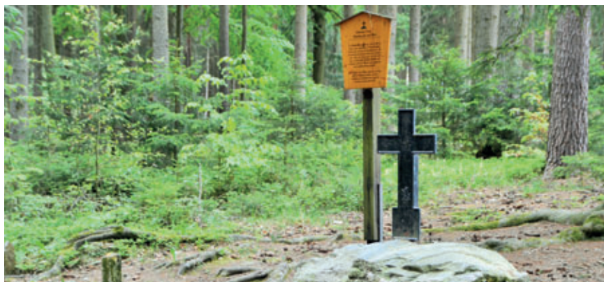
Das schwarze Kreuz im Thalheimer Wald, ein Sühnekreuz

wo ist der Wanderweg „Wildes Erzgebirge“, lautete unsere Frage im Stadtanzeiger des Monats Juni? Hat es Ihnen „Wurzelrudi“ verraten? Es ist die Region Eibenstock/Sosa/Blauenthal, eine wildromantische Ecke des Erzgebirges.