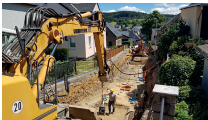
In der Schulstraße zwischen Hauptstraße und Gartenstraße wurde unter anderem durch den ZWW neue Kanäle eingebaut. Die Stadt hat den Straßenbelag erneuert.