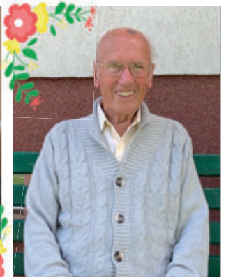
⬆ Herr Einer