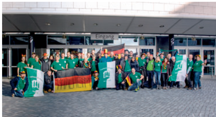
» Die Abteilung Handball des SV Tanne Thalheim hat uns diese Bilder von der Handball WM in Berlin gesendet. Mit auf dem Bild oben ist auch der ehemalige Handballnationalspieler Markus Baur.