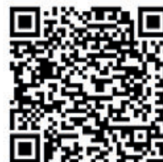
⬆ Allgemeinverfügung AFB