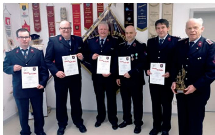
» Die Kameraden wurden für ihre lange Zugehörigkeit zur FFW Thalheim geehrt