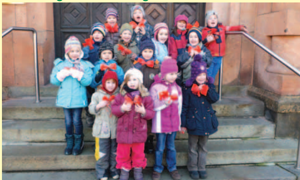
„Bienenkorb“ sowie „Kinderland am Steinberg e. V.“ und brachten uns auch ihren selbstgebastelten Baumschmuck.