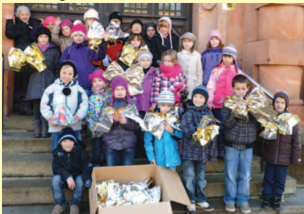
Am 15.11.2012 brachten die Kinder des 3-Tannen-Hortes ihren selbstgebastelten Baumschmuck in das Thalheimer Rathaus.