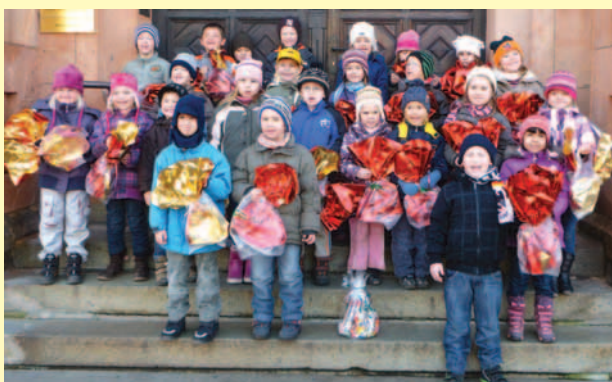
Einen Tag später besuchten uns die Kinder der Kindertageseinrichtung „Sonnenschein“,