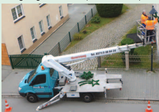
Die Mitarbeiter des städtischen Bauhofes beim Aufbau der ca. 7 m hohen, sich täglich in der Weihnachtszeit drehende Pyramide.

Auch schmückten am 26.11.12 die Mitarbeiter unsere Stadt mit Lichterketten, Lichterbögen und Sternen.