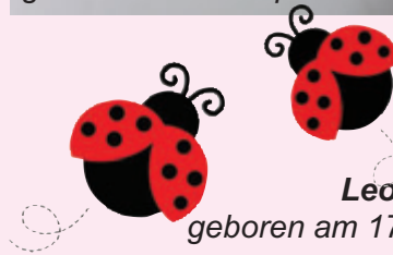
Leonie Auerswald geboren am 17. Oktober 2015