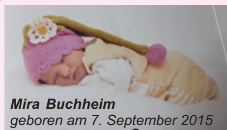
Mira Buchheim geboren am 7. September 2015