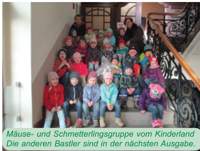
Mäuse- und Schmetterlingsgruppe vom Kinderland Die anderen Bastler sind in der nächsten Ausgabe.