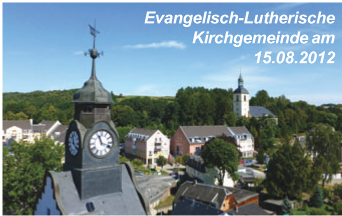
Evangelisch-Lutherische Kirchgemeinde am 15.08.2012