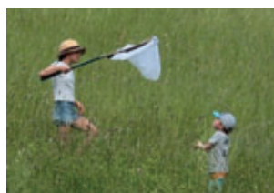
Fotos oben: Artenbestimmung mit Kinderaugen – so viele verschiedene Farben und Tiere waren auf einem Quadratmeter „Pfarrberg-Wiese“ zu finden.

Die Mitglieder des Naturschutzvereins Zwönitztal e.V.