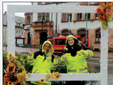
Photopoint am Rathaus