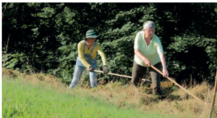
^ Mitglieder bei der Wiesenpflege